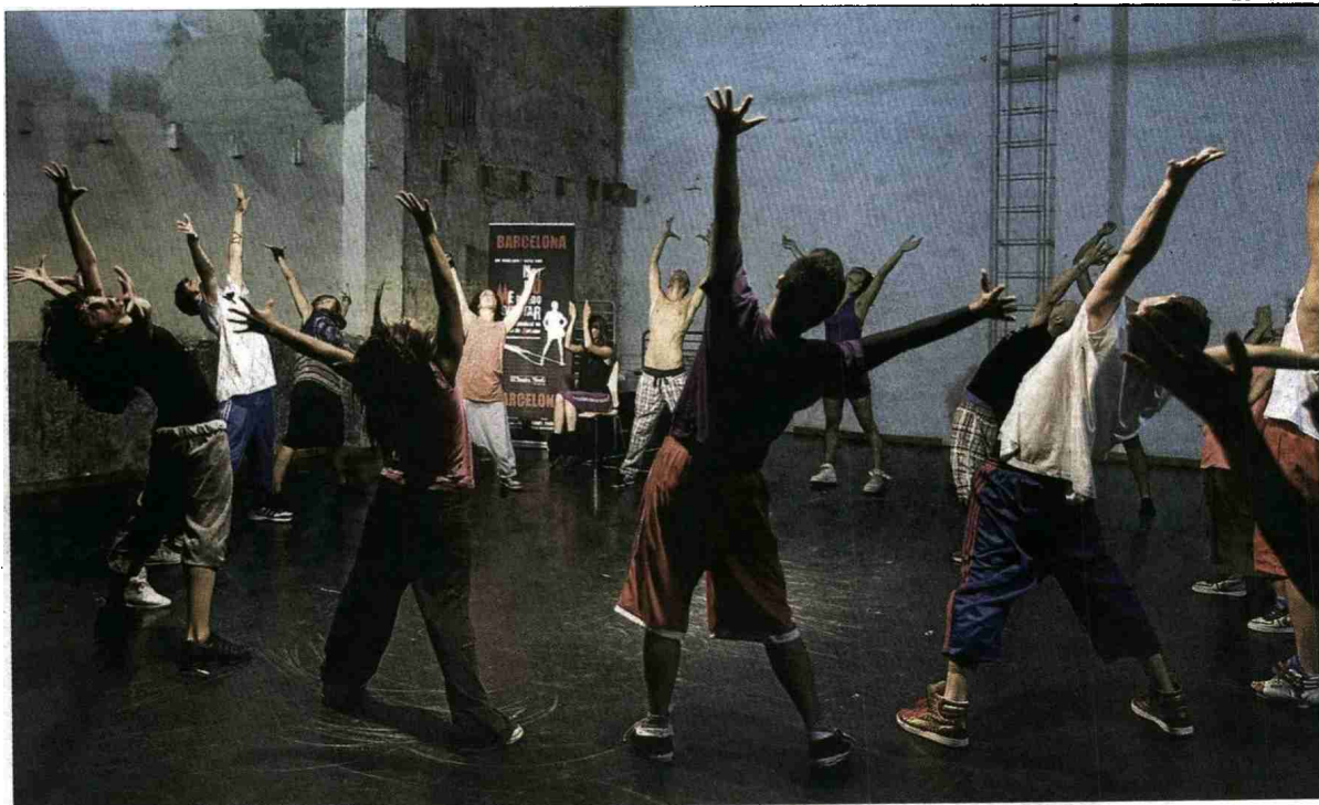
►► Un momento de los ensayos del cuerpo de baile, ayer en la sala Nau Ivanow de Barcelona.

GEMELOS Y UN CHINO // Así es Marcos, gaditano de padres chinos, que se sincera: «Yo en estilo clásico pincho, por suerte hay poco, pero las piruetas se me dan fatal. Voy más lento para retener los pasos que mis compañeros más jóvenes. Hay una nueva generación de bailarines que son muy hábiles y rápidos». Él creció escuchando al hip hop, que aprendió con sus colegas viendo vídeos. «He sido autodidacta a la fuerza, porque las clases eran muy caras. Mi madre quería que me dedicara a esto, pero ahora está más tranquila. Es muy fácil vivir de lo que te gusta y en el oficio hay mucho trepa con maña. Tengo 26 años y esta era mi última oportunidad. Por suerte, buscaban a quien asiático».