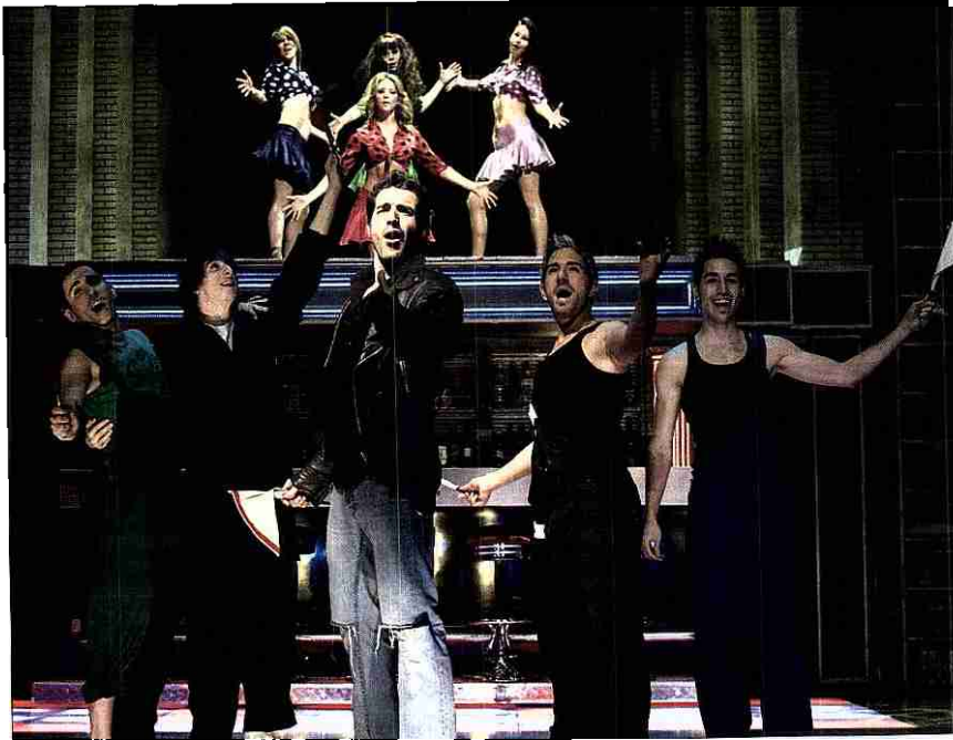
Uno de los medleys de Hoy no me puedo levantar , con los cantantes y bailarines.